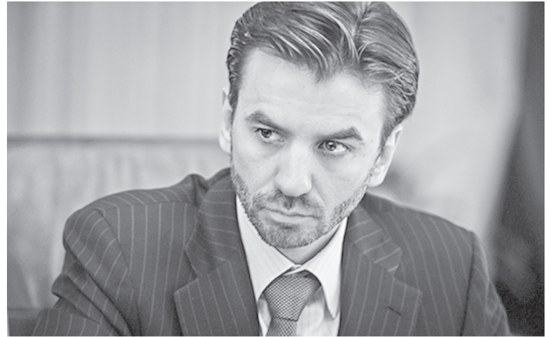
Министр РФ по вопросам Открытого правительства Михаил Абызов:

Тем не менее предугадать дальнейшие колебания валюты сейчас нелегко. Именно поэтому аналитики не дают четкого ответа, в какой валюте сегодня лучше хранить сбережения. Эксперты предупреждают об ослаблении рубля, советуют обычным гражданам повременить со сдачей валюты. Хотя, по их мнению, сильно национальная валюта падать не будет, все же 52 рубля за доллар для курса национальной валюты выглядят слишком заниженными. При этом и рублевые сбережения на «новогодних» депозитах со ставками, близкими к 20% годовых, аналитики трогать не советуют. Главное правило - копить деньги в той валюте, в которой вы собираетесь их тратить. Если планируете поездку за рубеж, где в ходу доллар или евро, откладывайте именно их. А если в планах отдых в России, то, соответственно, экономить и откладывать стоит рубля.