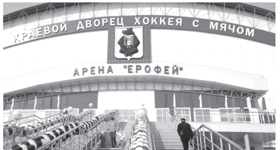
Ульяновская область перегонит Хабаровский край как минимум в одном. Если на ЧМ-2015 все игры прошли на одной ледовой арене, во Дворце спорта «Ерофей», то через год - на ЧМ-2016 - будут заняты сразу два города, Ульяновск и Димитровград, и не менее трех ледовых площадок

Провести его в двух городах (в Ульяновске и Димитровграде).