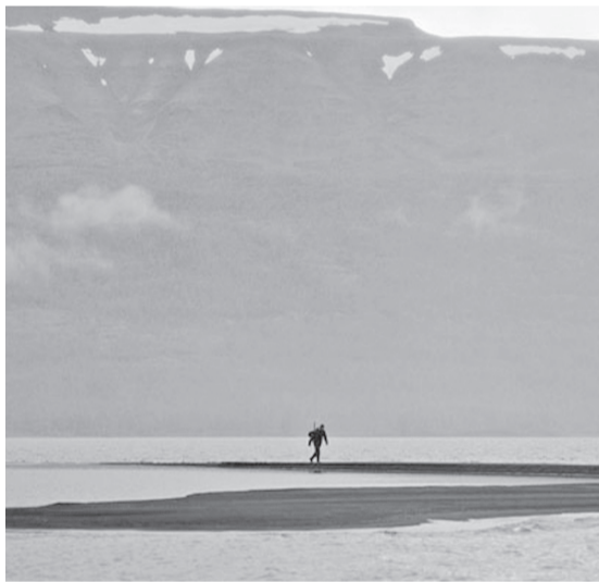
Съемки драмы велись в таких местах, куда не занесет туриста

Стр. 2 - Нам хочется верить, что мы сняли нужный фильм. Про героических людей, которые возрождали нашу страну, ее промышленность и делали мир будущих детей. Помните, один из героев говорит, что, прежде чем появится город, надо, чтобы пришли люди, которые смогли бы жить с природой. Герои фильма - геологи, а не золотоискатели. У них есть ответственность перед другими, государственные задачи, широкий кругозор. Мы идем по стопам Куваева - романтизируем историю, стараемся вернуть романтическое отношение к профессии и хотим, чтобы люди, живущие в больших городах, узнали смысл этой романтики, - говорит режиссер.